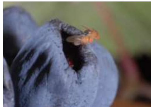
Abb. 1: Vorgeschädigte Beeren werden von Essigfliegen gerne befliegen.