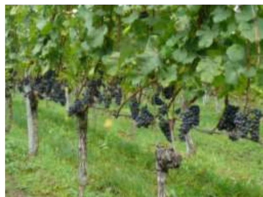
Abb. 3: In einer gut entblätternen und damit luftigen Traubenzone sind nachweislich weniger Kirschessigfliegen zu finden.